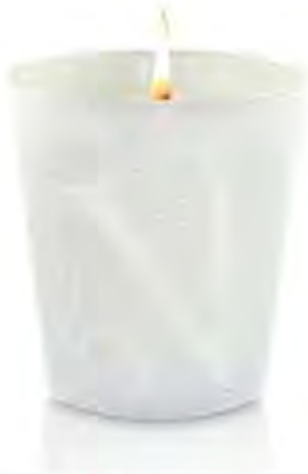
VRANJES - ROSSO NOBILE