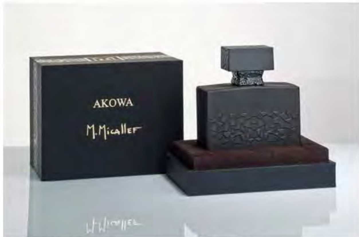
AKOWA – ein Duft für anspruchsvolle und geheimnisvolle Männer. 100 ml EdP gesehen um € 195,-

Mit AKOWA von M. Micallef wird ein maskuliner, sinnlich-holziger Duft vorgestellt, der nach einem geheimnisvollen afrikanischen Stamm benannt ist. Die Basis bilden Wurzeln afrikanischer Pflanzen, die mit fruchtigen Noten, Kakao, Ambra und Weißem Moschus angereichert werden. Es ist ein Duft für anspruchsvolle und entschlossene Männer die sich gerne mit einer geheimnisvollen Aura umgeben. 100 ml EdP gesehen um € 195,-