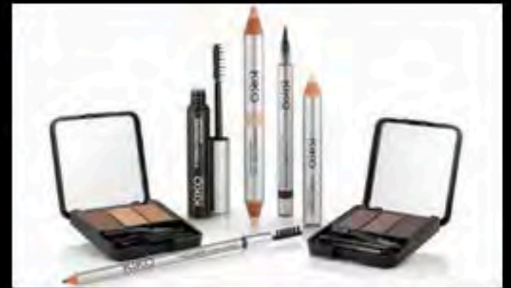
SCHÖNE, DICHTER BRAUEN