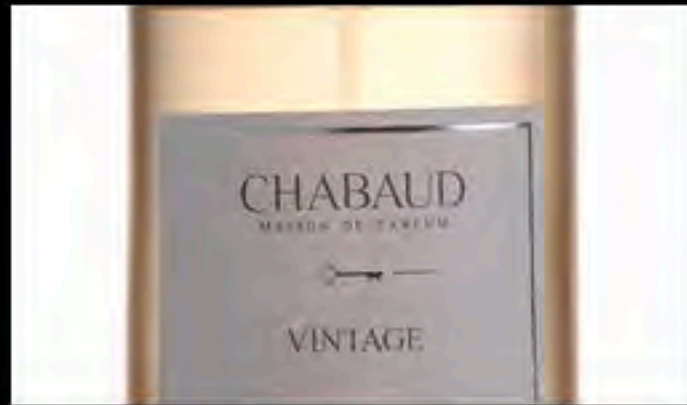
INSPIRIERT VOM GLAMOUR DER 40ER & 50ER